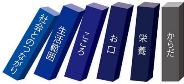
図 フレイル・ドミノ

加齢に伴い、身体機能や認知機能が低下した状態を「フレイル」と呼びます。この状態は、要介護になる前の段階ですが、自立して日常生活を送ることが出来る時期です。この時期に生活習慣を見直すことで、要介護になる時期を遅らせ、予防することが出来ます。 最近の研究によると、フレイルの始まりは、 社会とのつながりを失うこと である、 社会とのつながりを失う (下図)。心豊かな生活を送るためには、社会とのつながりを保つことが大切です。