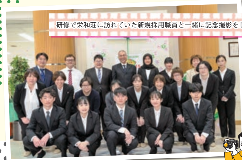
研修で栄和荘に訪れていた新規採用職員と一緒に記念撮影をしました。