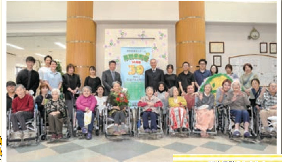
記念撮影をしました。