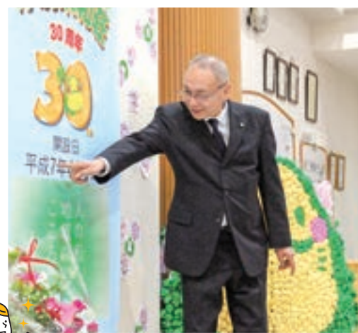
瀬戸常務からお話がありました。