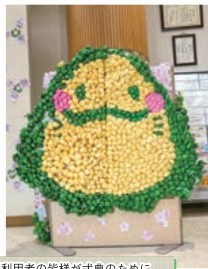
ご利用者の皆様が式典のために作成しました。