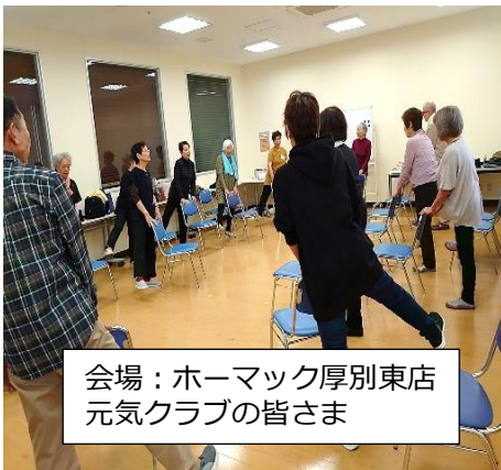
会場：ホームック厚別東店 元気クラブの皆さま

体操など介護予防活動を実施しているグループに対して、運営の助言、専門職の講話、体力測定の