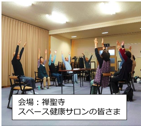
会場：禅聖寺 スペース健康サロンの皆さま

『介護予防センターは何をしているところなの?』と聞かれることもあり、少しでも当センターの活動を皆さんにお知らせできればと思い通信を発行することにしました。 介護予防センターは、札幌市より委託を受けて活動をしていきます。厚別区には地域毎に4か所の介護予防センターがあり、当センターは厚別西・厚別北・厚別東・山本地区を担当しています。