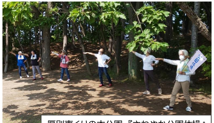
厚別東くりの木公園 『さわやか公園体操』 サッポロスマイル体操 クラークポーズ！