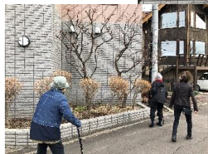
この3名で開花を確認しました！