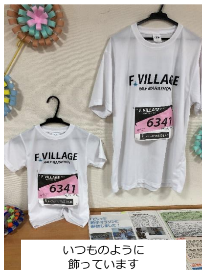
いつものように飾っています

さて、今月も皆さんお楽しみにされている（！）このコーナーです。 先月号で「6月はあの場所で開催される親子マラソンに三男と参加してきます。」とお伝えしましたが、今回はその大会のご報告でした。ご利用されている方はすでにご存じの方が多いと思いますが、ファイターズの本拠地である北広島にあるエスコンフィールド北海道で開催されたマラソン大会に参加してきました。 距離は3km。私にとっては近所の散歩程度の感覚。ただ小学校1年生の三男にとっては未知の世界でした。スタート前には偶然にも通っていた保育園の先生方がいらつしやり、黄色い声援が飛んできて、三男はまんざらでもない表情。走り出した途中で「血の味がする」と苦悶の表情をしていました。見事完走。タイムは19分となかなかの好タイム。完走後は「楽しかった！また走りたからね！」と。血は争えない事がわかりました（笑）終了後はファイターズの関係者から声を掛けられパシャリと記念写真。よい思い出になりました。