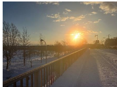
北広島市の朝日です。 時に雲海もあり、なかなかきれいですよ！