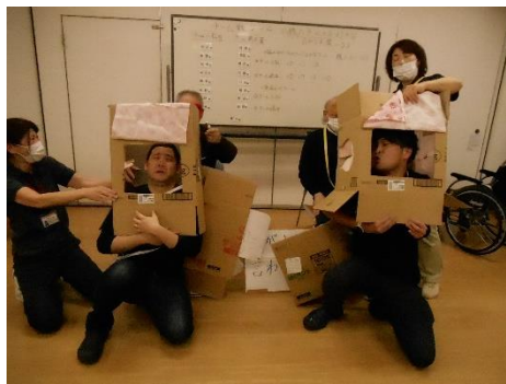
箱の中身は何だろう？ゲーム 最後は私も箱の中へ。