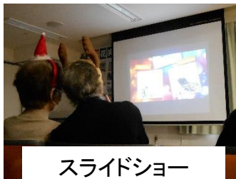
スライドショー 感動しました